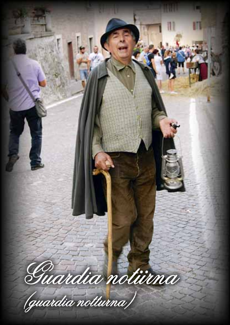
Guardia noturna (guardia notturna)