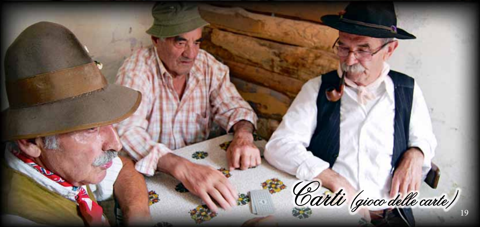
Carti (gioco delle carte)