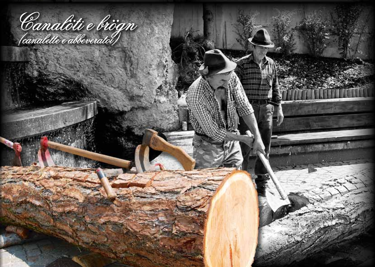
Canalòti e brögn (canalette e abbeveratoi)