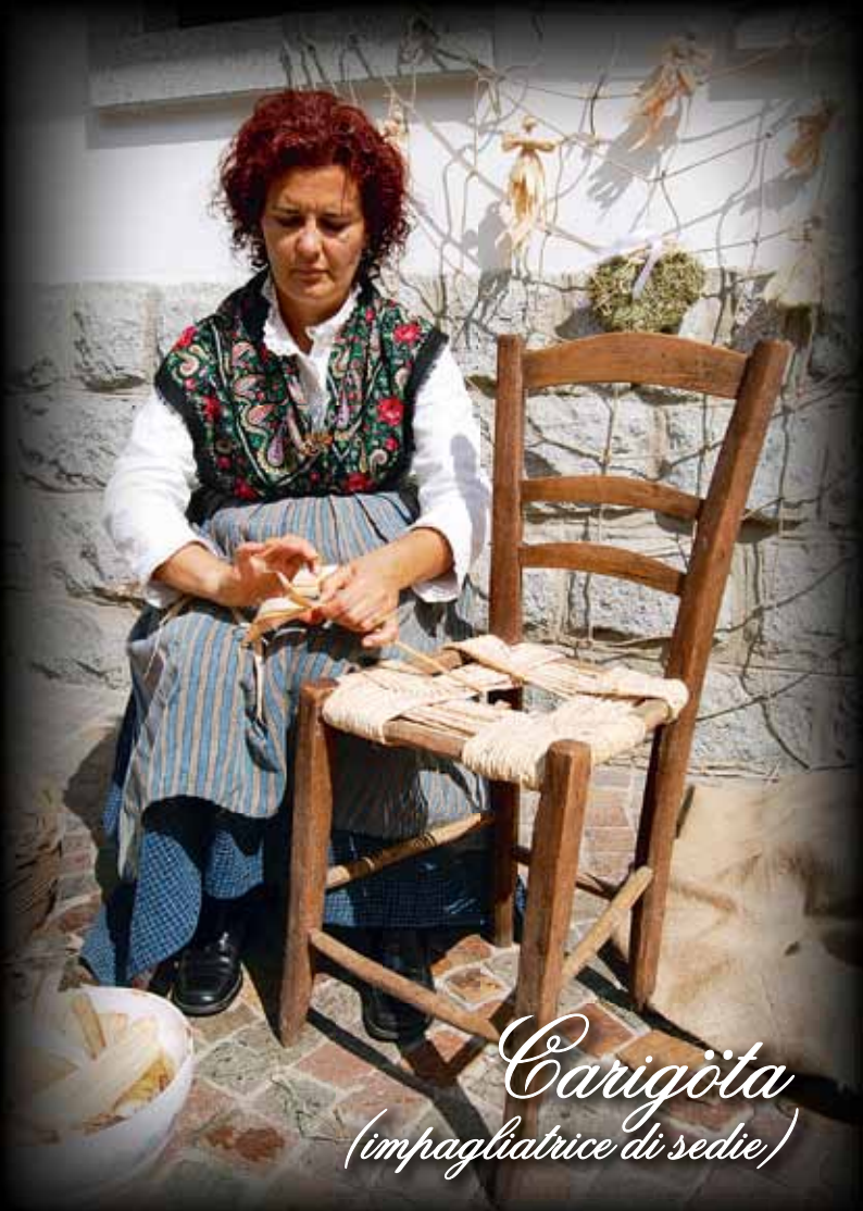
Carigöta (impagliatrice di sedie)