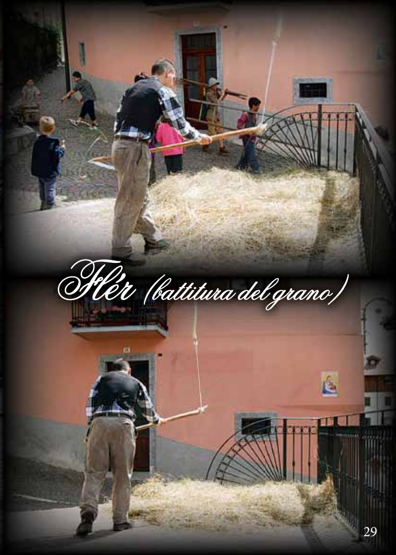
Fèr (battitura del grano)