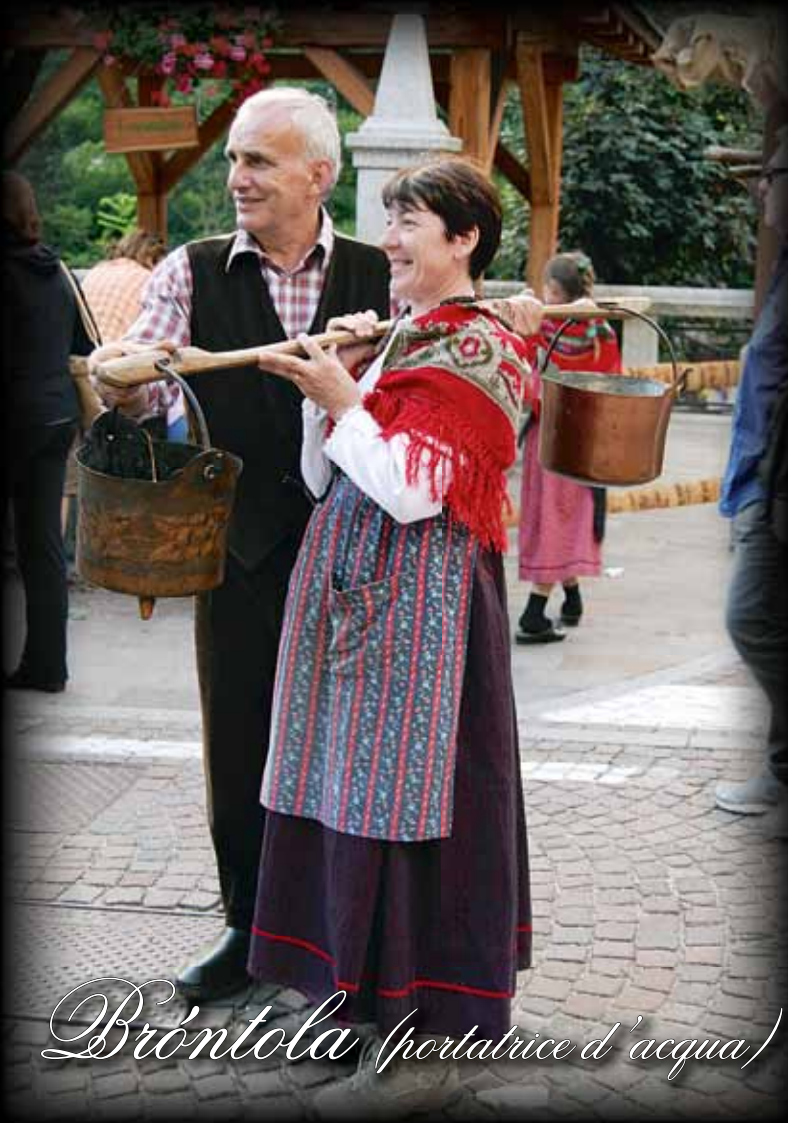
Bròntola (portatrice d'acqua)