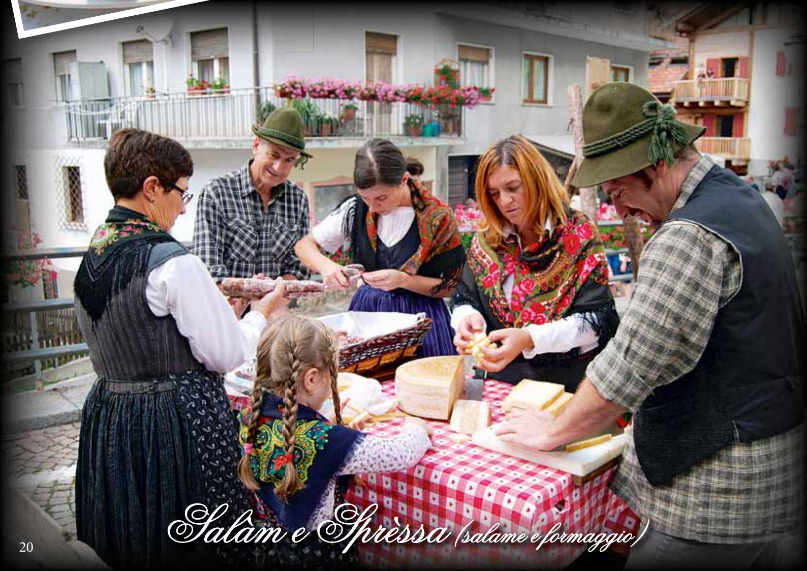
Salam e Sprèssa (salame e formaggio)