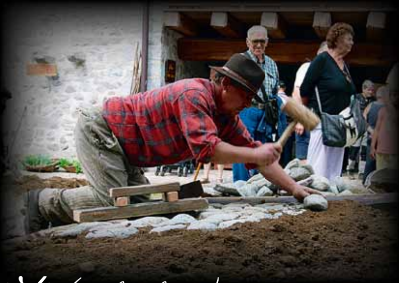
Ruzöl di buciàti (vicolo selciato)