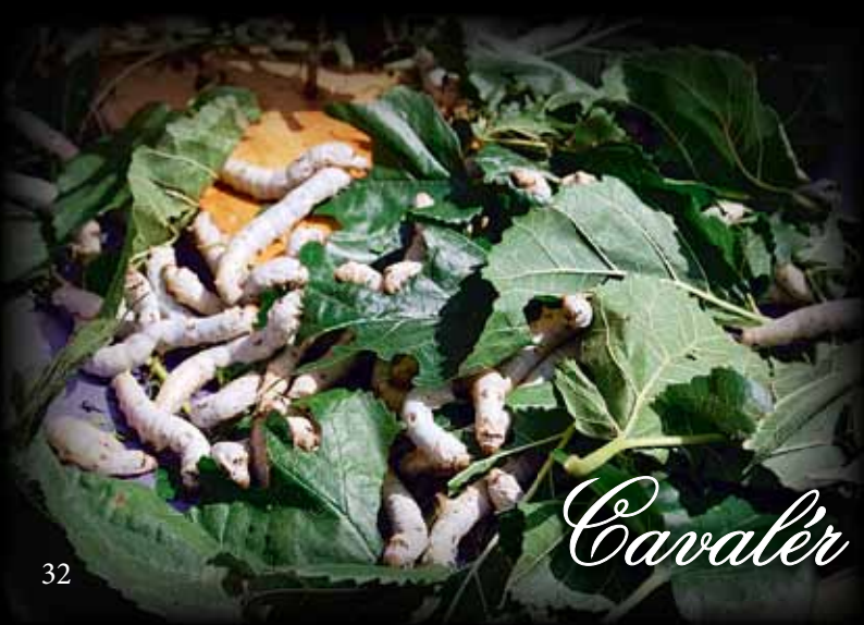
Cavalèr (bachi da seta)