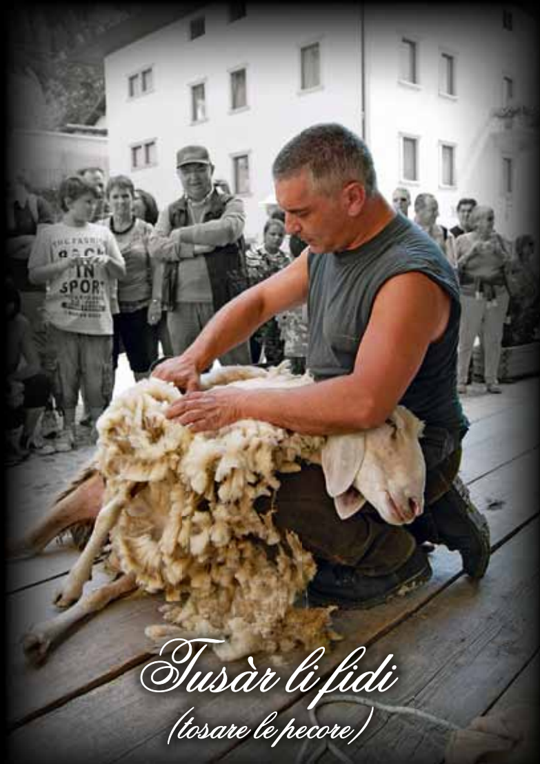
Tusàr li fidi (tosare le pecore)