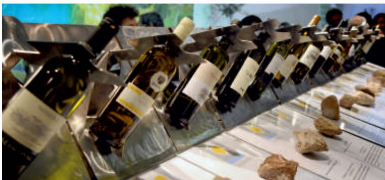
Realizzazione degli espositori dei prodotti in mostra a cura dell'arch. Santuari.

Una ricchezza di tradizioni ed esperienze protagoniste anche quest'anno della nuova edizione di DiVinNosiola . L'appuntamento è a Trento e nelle più belle località della Valle dei Laghi dal 3 al 21 aprile .